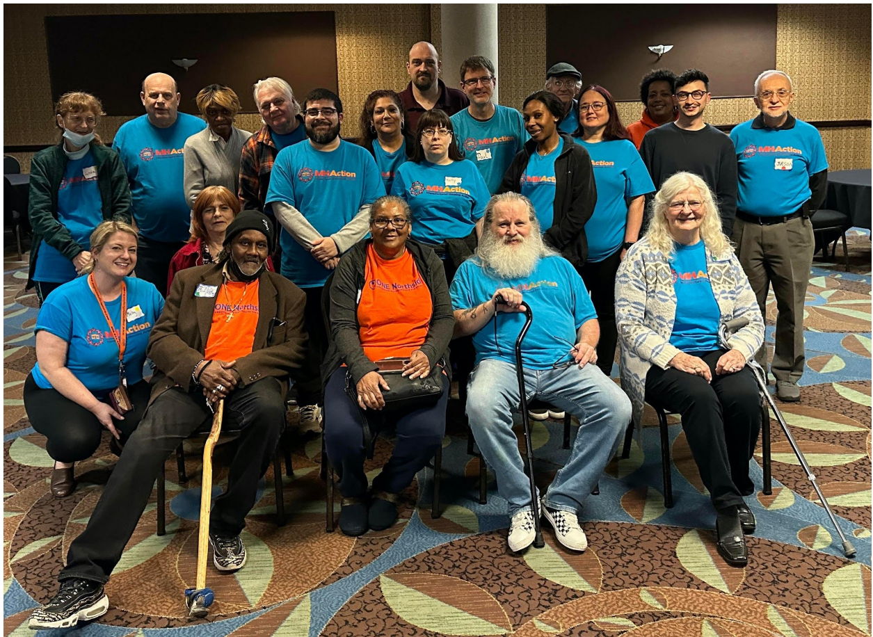
Residentes líderes del Medio Oeste en nuestra reciente capacitación transversal en liderazgo en Springfield, IL

Además de reunirse con los legisladores para hablar sobre la necesidad de proteger la vivienda asequible de los especuladores corporativos predatorios, los líderes tuvieron la oportunidad de participar en una capacitación transversal en liderazgo que se centró en mejorar las habilidades de narración de historias y la comprensión del papel que juegan las historias en las campañas. Gracias a Steal Estate , una experiencia web interactiva de Rise-Home Stories , los líderes pudieron analizar las formas en que las prácticas abusivas en materia de vivienda afectan a los inquilinos y propietarios por igual, y qué soluciones pueden encontrar ambas comunidades de forma solidaria.