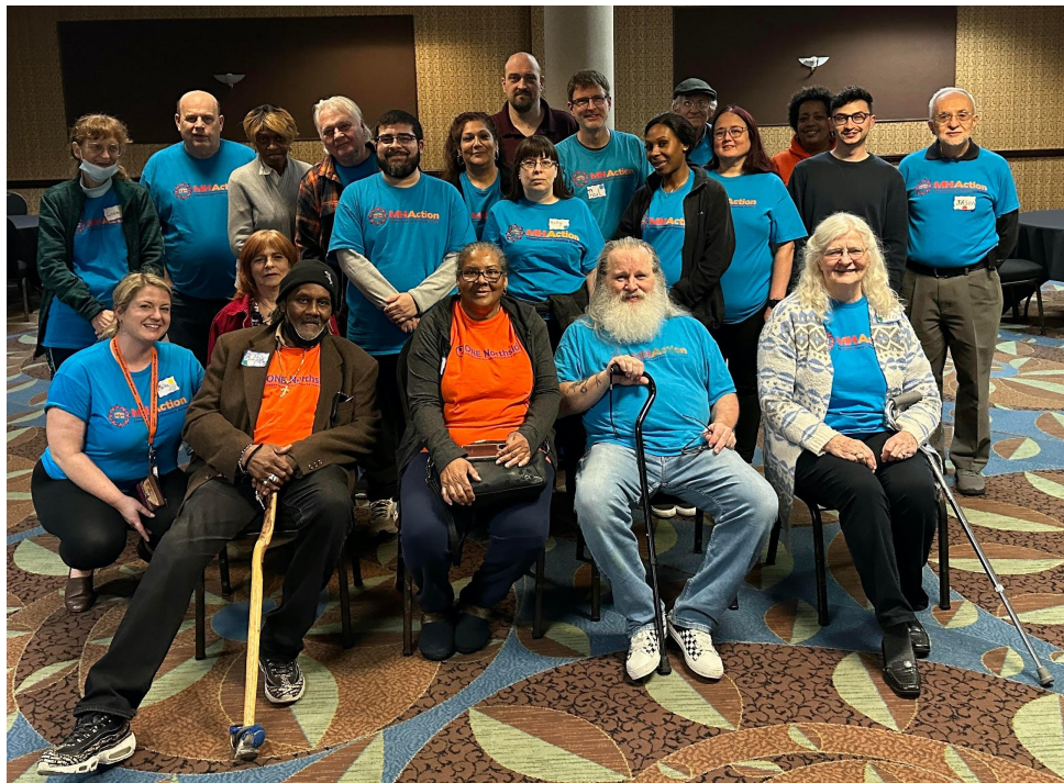
Midwest resident leaders at our recent Leadership Cross Training in Springfield, IL

Along with meeting with legislators to talk about the need to protect affordable housing from predatory corporate speculators, leaders had the opportunity to participate in cross training that focused on sharpening storytelling skills and understanding the role of stories in campaigns. Thanks to Steal Estate , an interactive web experience by Rise-Home Stories , leaders were able to discuss the ways in which predatory housing practices affect renters and homeowners alike, and which solutions both communities can build together in solidarity.