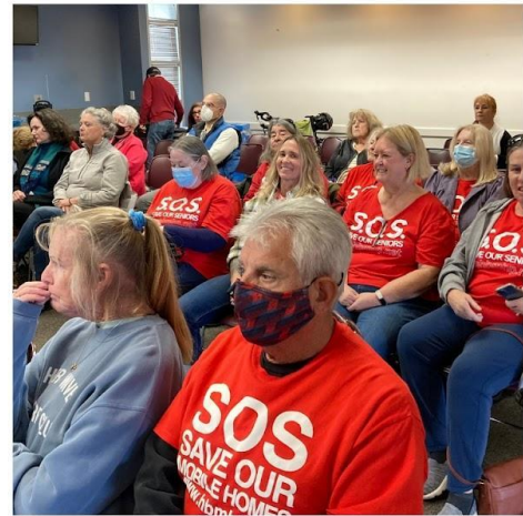
CA resident leaders making their voices heard!

We are also standing with the Housing Now! California coalition, which is proposing legislation to strengthen rent setting protections for all renters in California. MHAction leaders believe that the housing rights movement is strongest when renters and residents of manufactured housing communities stand together on housing justice efforts.