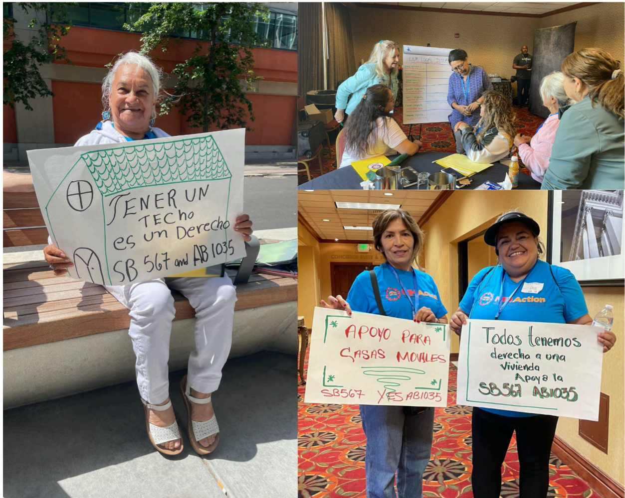
Residentes líderes de CA mostrando sus carteles en la capacitación transversal en liderazgo de CA

Sin bien el AB 1035 será tratado en 2024, ¡nos complace anunciar que el SB 567 fue aprobado! ¡Saludamos a nuestros hermanos y hermanas que luchan por una vivienda asequible en todas las comunidades! ¡Gracias a los líderes y organizadores de ACCE Action, Housing Now! CA , y a todos los que luchan para que se aprueben estas protecciones a la vivienda.