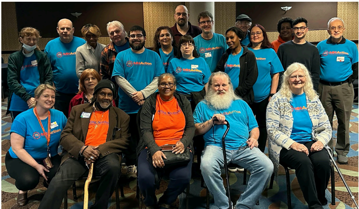
Líderes del Medio Oeste en la capacitación transversal en liderazgo de IL

Nos complace anunciar que ya tenemos un proyecto de ley, el HB 4104 , diseñado para garantizar la asequibilidad futura de nuestras comunidades. Este proyecto de ley permitiría a las comunidades individuales decidir si quieren o no adoptar medidas de estabilización de alquileres que protejan a los inquilinos y propietarios de viviendas prefabricadas en el estado de las praderas. ¡Además de las reuniones presenciales con los legisladores, los líderes también han comenzado a enviar cartas en línea , pidiéndoles que apoyen el proyecto de ley!