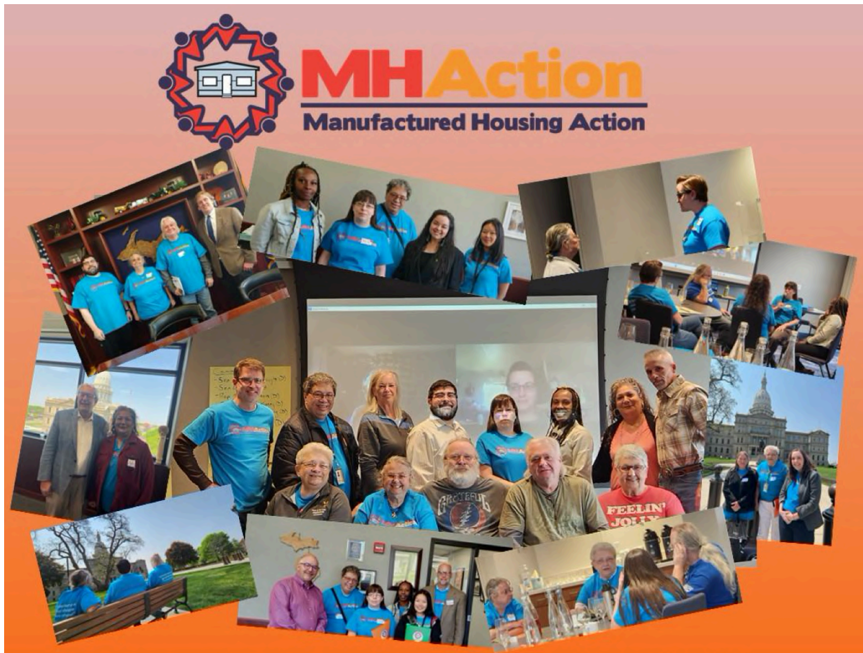
Momentos destacados de la capacitación transversal en liderazgo de MI

El paquete de proyectos de ley con protecciones para los residentes de viviendas prefabricadas ya se ha presentado tanto en la Cámara de Representantes como en el Senado del Estado de Michigan. Los líderes de los residentes siguen haciendo oír su voz, compartiendo sus historias y reuniéndose con los representantes estatales para asegurarse de que sean aprobadas estas importantes protecciones contra los propietarios abusivos. ¡Leer un resumen de los proyectos de ley AQUÍ!