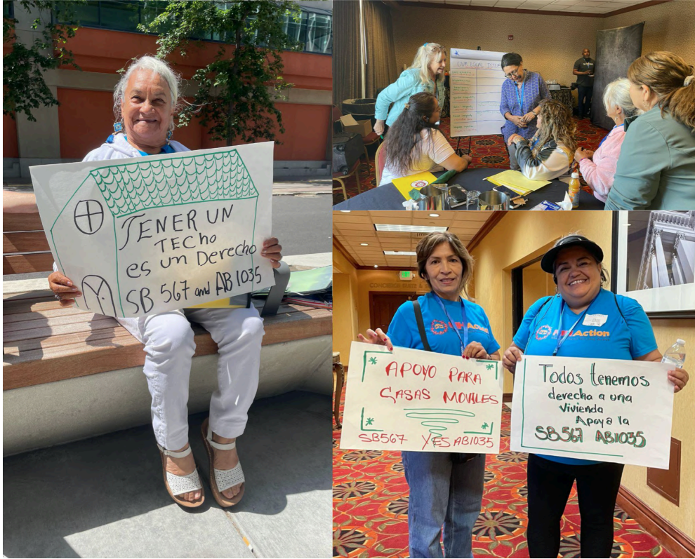
CA resident leaders showing off their signs at the CA Leadership Cross-Training