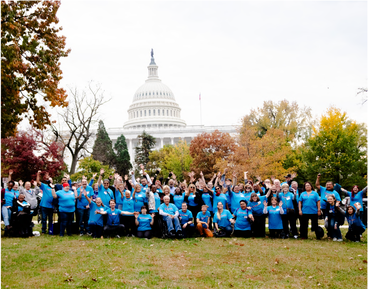
Encuentro Nacional de MHAccion de 2023 en Washington, DC