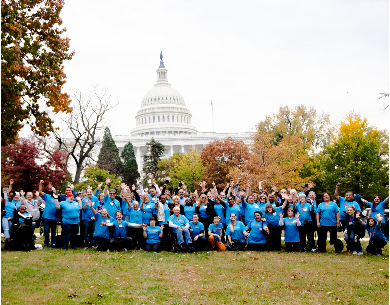
MHAction 2023 National Gathering in Washington, DC