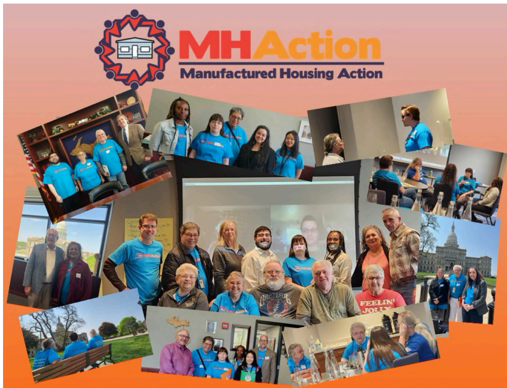
Highlights from the MI Leadership Cross-Training

The bill package with protections for manufactured housing residents has now been introduced in both the Michigan State House and Senate. Resident leaders are continuing to make their voices heard, sharing their stories and meeting with state representatives to make sure these important protections against predatory ownership pass. Read a summary of the bills HERE!